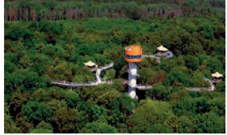
Baumkronenpfad im Hainich