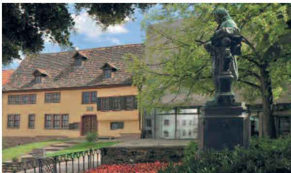
Bach-Museum und Denkmal

Am Abend wird ein Sammeltaxi zur Rückkehr nach Hütscheroda organisiert. Weitere Hotelübernachtungen bitte individuell buchen.