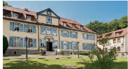
Hotel „Zum Herrenhaus“