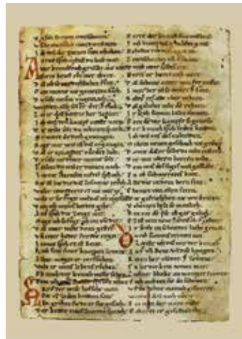
Originalhandschrift aus Parsifal