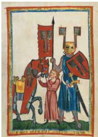
Wolfram von Eschenbach aus der manessischen Liederhandschrift