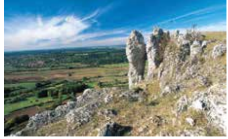
Wandern in der fränkischen Schweiz