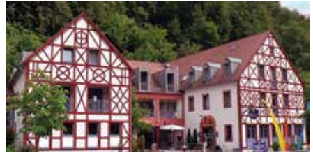
Behringers Freizeit- und Tagungshotel