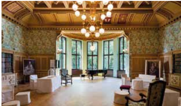
Innenansicht des Museums

(Gepäck kann im Bahnhof abgestellt werden.)