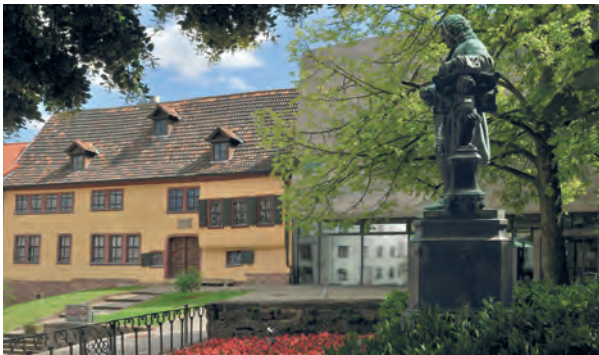
Bach-Museum und Denkmal

Am Abend wird ein Sammeltaxi zur Rückkehr nach Hütscheroda organisiert. Weitere Hotelübernachtungen bitte individuell buchen.