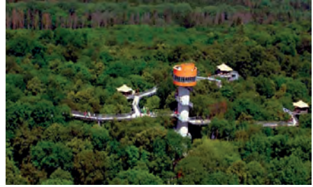
Baumkronenpfad im Hainich