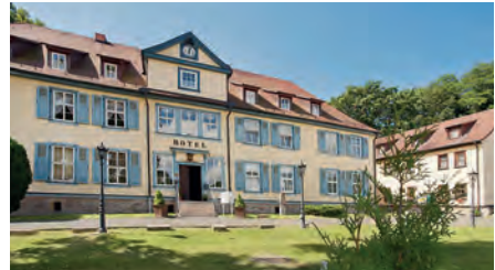
Hotel „Zum Herrenhaus“