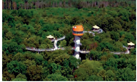
Baumkronenpfad im Hainich